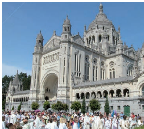
Sainte Thérèse, saints Louis et Zélie Martin

Trois saints d'une même famille réunis au cœur de la Normandie