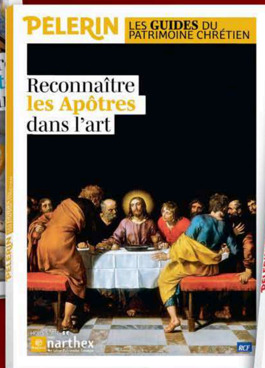
Reconnaitre les Apôtres dans l'art